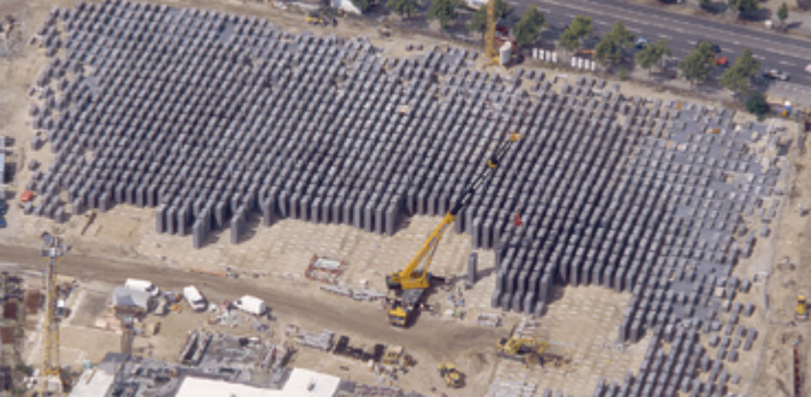
Resning av minnesmärket, juli 2004