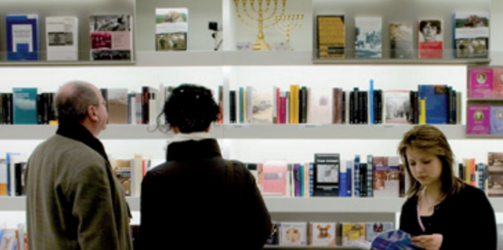
Bokhandel i museet – Informationcentrum