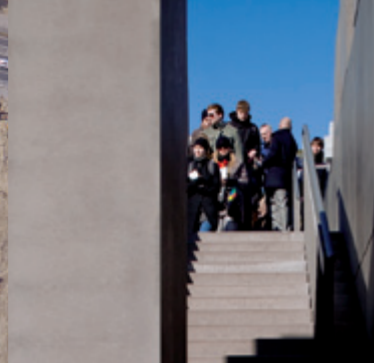
Ingång till det underjordiska Informationcentrum