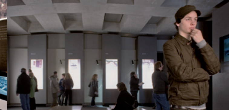
Sala de los Lugares