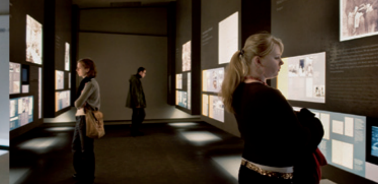
Sala de las Familias