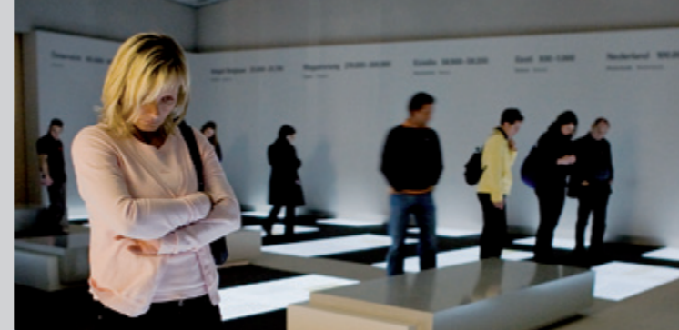
Sala de las Dimensiones