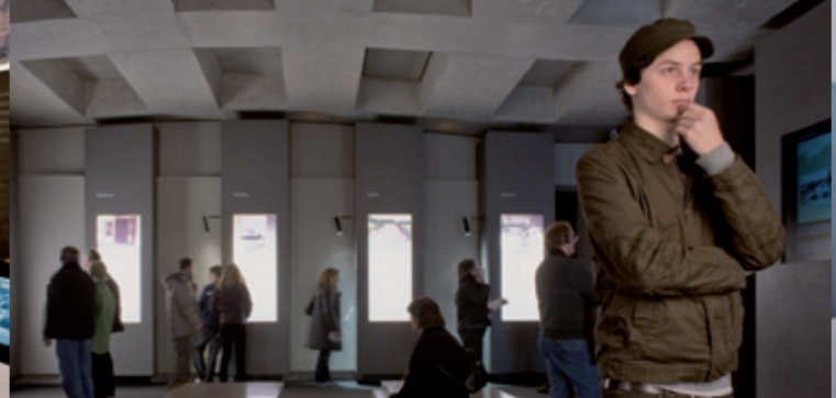
Зал исторических мест