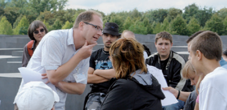
Ученики на семинаре на площади со стелами