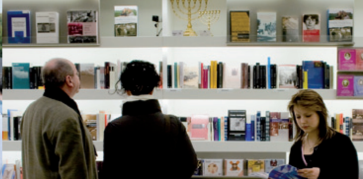
Книжный магазин в Информационном Центре