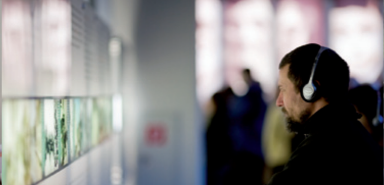
Посетители на аудиоэкскурсии в Информационном Центре