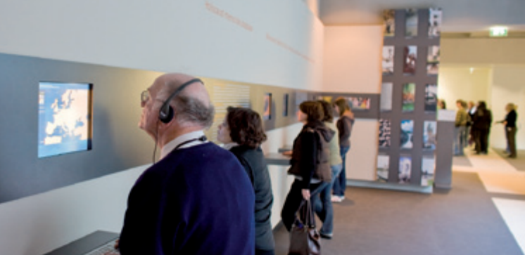
Портал памятных мест