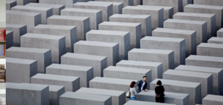
Площадь со стелами