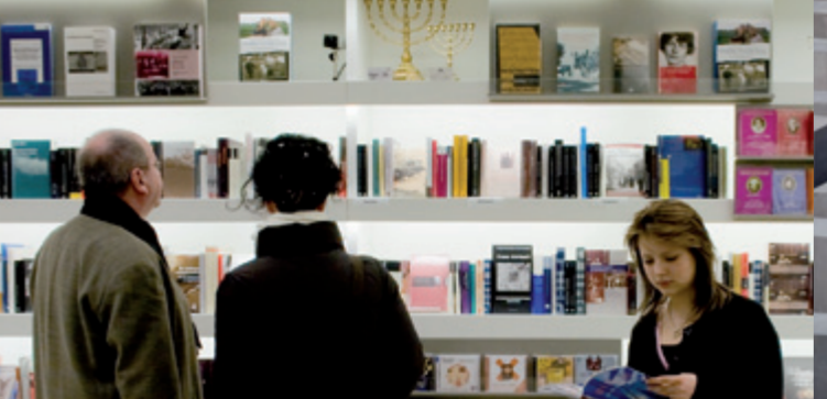
Księgarnia w Centrum Informacji