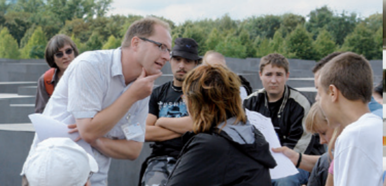
Warsztaty dla uczniów na polu stel