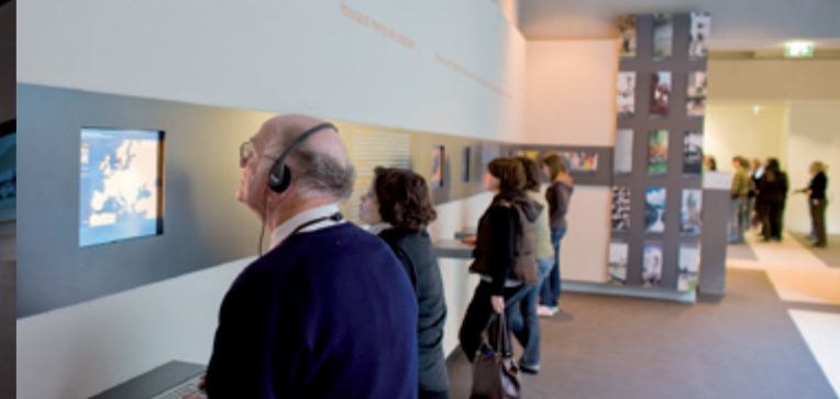
Portal miejsc pamięci