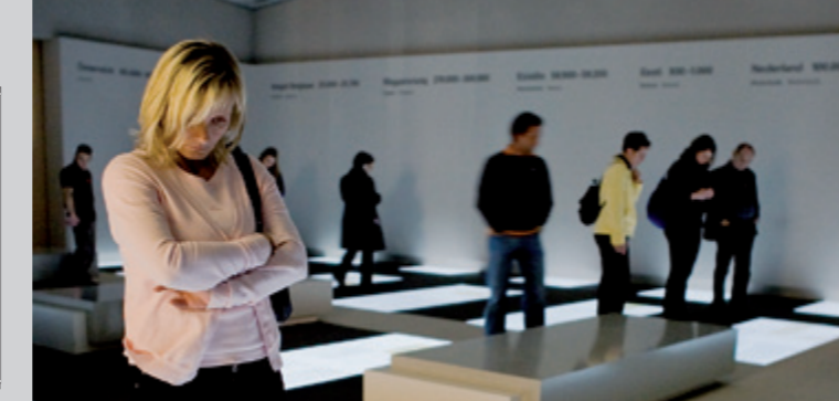
Salle des Dimensions