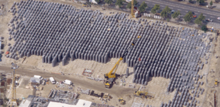
Construction du mémorial, juillet 2004