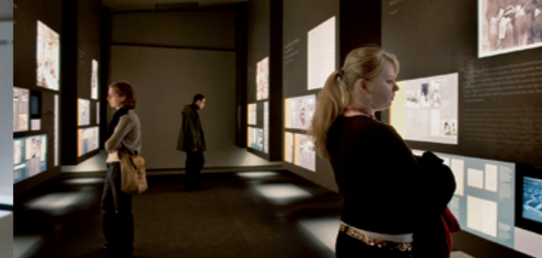
Salle des Familles