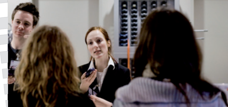
Personne chargée de l'accueil discutant avec des visiteurs du centre