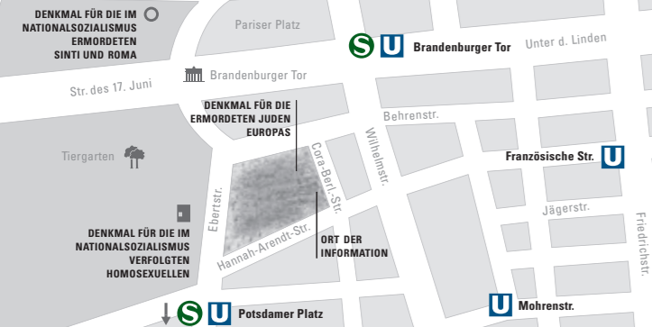
Plan d'accès et transports en commun