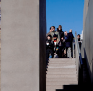
Entrée du Centre d'Information situé dans le sous-sol