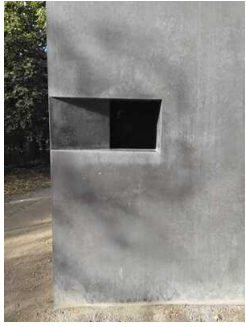
Denkmal für die im Nationalsozialismus verfolgten Homosexuellen