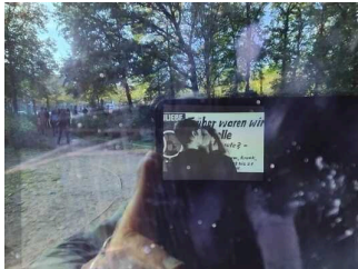
Denkmal für die im Nationalsozialismus verfolgten Homosexuellen