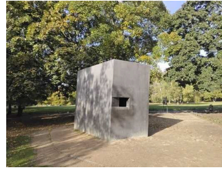
Denkmal für die im Nationalsozialismus verfolgten Homosexuellen