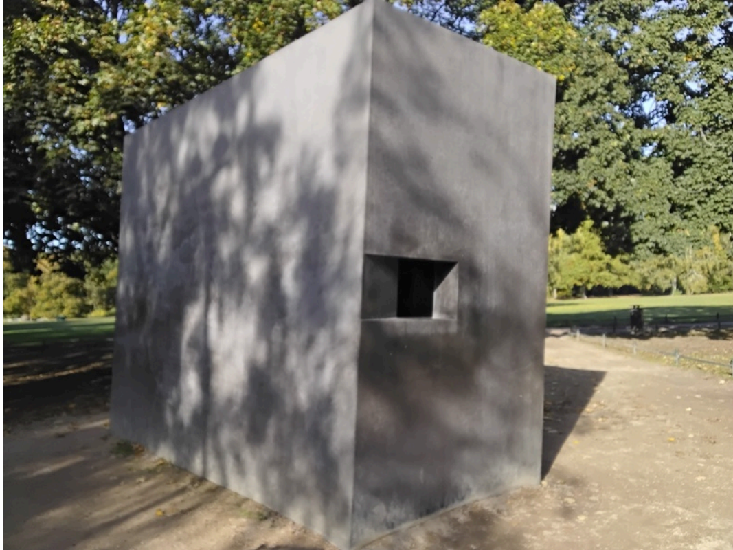
Denkmal für die im Nationalsozialismus verfolgten Homosexuellen