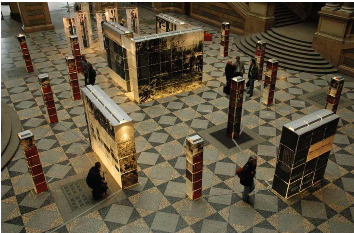
MÜNCHEN, Justizpalast (Lichthof)