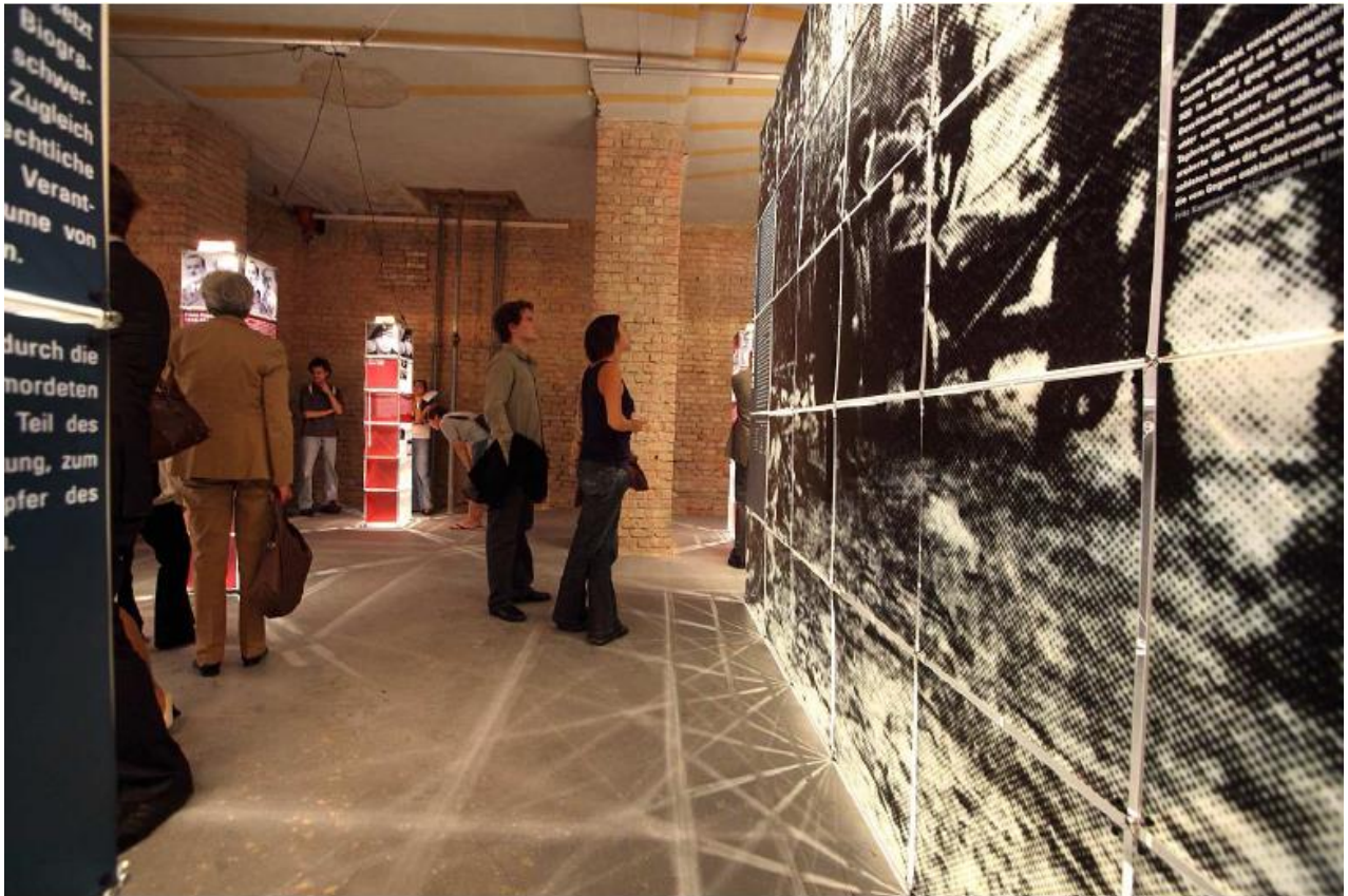
WIEN, Theater im Nestroyhof